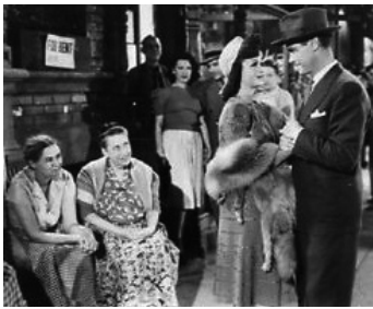
1940 GIRLS UNDER 21 de Max Nosseck