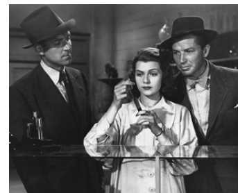
1939 HOMICIDE BUREAU de Charles C. Coleman avec Rita Hayworth