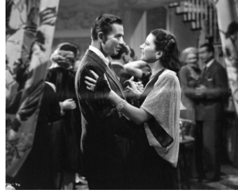
1945 DIVORCE (Divorce) de William Nigh avec Kay Francis