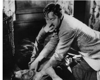
1935 LET'EM HAVE IT de Sam Wood avec Richard Arlen