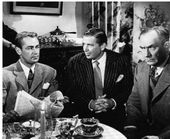
1945 SA DERNIÈRE COURSE (Salty O'Rourke) de Raoul Walsh avec Alan Ladd