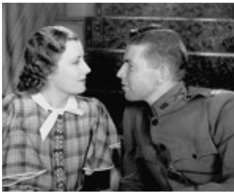
1933 ANN VICKERS (Ann Vickers) de John Cromwell avec Irene Dunne