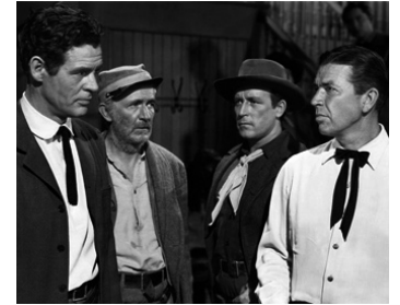
1951 PLUS FORT QUE LA LOI (Best of the Badmen) de W.D. Russell avec Robert Ryan, W. Brennan