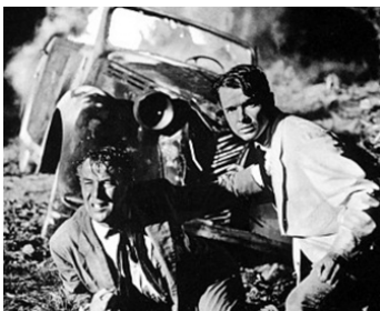
1958 UN AMÉRICAIN BIEN TRANQUILLE (The Quiet American) de J. Mankiewicz avec Audie Murphy