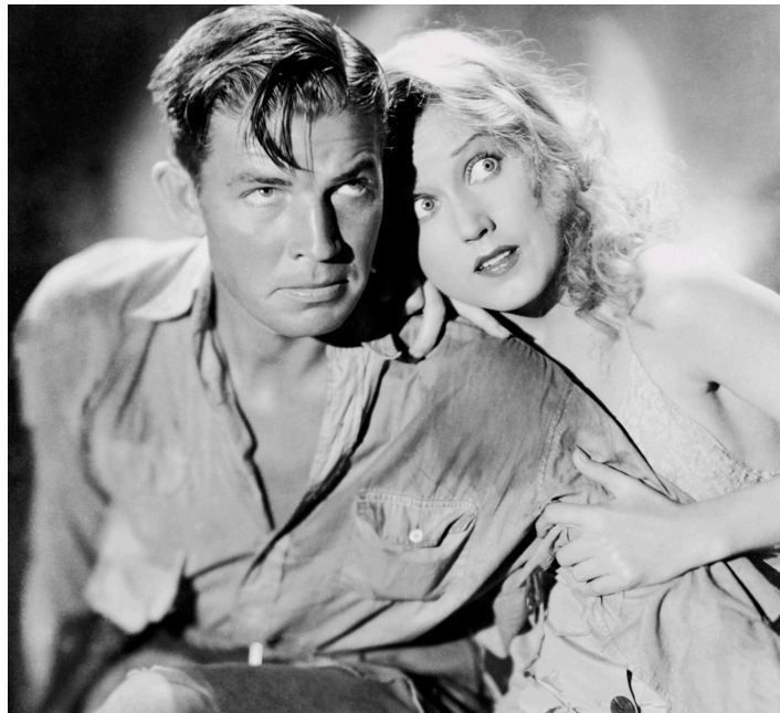
1933 KING KONG (King Kong) d'Ernest B. Schoedsack et Merian C. Cooper avec Faye Wray