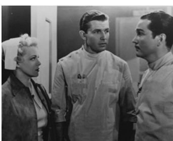
1939 LA CHAMBRE BLANCHE (The Mystery of the white Room) de Tay Garnett avec Helen Mack