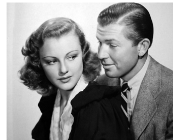
1937 BAD GUY d'Edward Cahn avec Virginia Grey