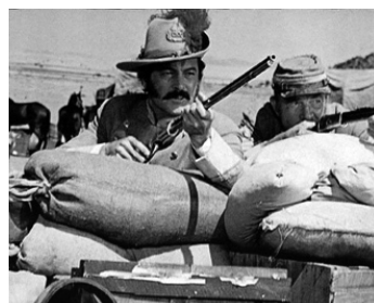
1969 LES GÉANTS DE L'OUEST (The Undeclared) d'Andrew McLaglen avec Rock Hudson