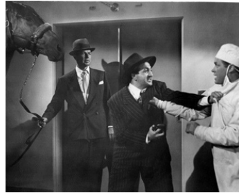
1949 SORROWFUL JONES de Sidney Lanfield avec Bob Hope