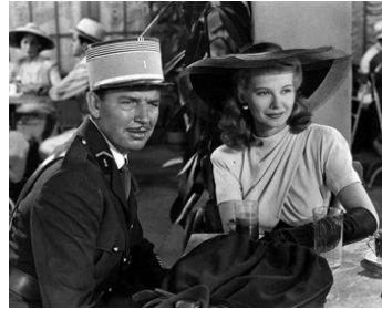
1943 LE CHANT DU DÉSERT (The Desert Song) de Robert Florey avec Irene Manning