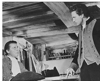
1959 JOHN PAUL JONES (John Paul Jones) de John Farrow avec Robert Stack