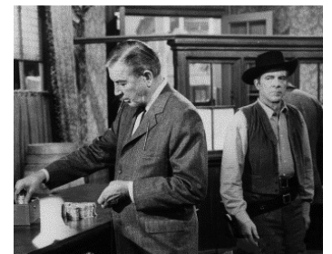
1965 QUAND PARLE LA POUDRE (Town Tamer) de Lesley Selander avec Dana Andrews