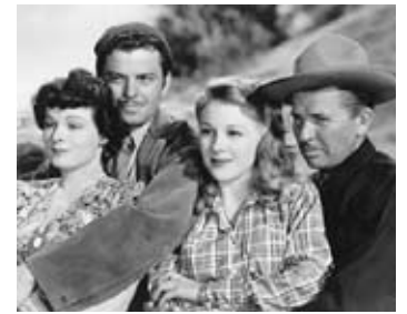
1942 PIERRE OF THE PLAINS de George B. Seitz avec Ruth Hussey, Evelyn Ankers, J. Carroll