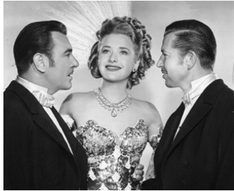
1942 LA REINE D'ARGENT (Silver Queen) de Lloyd Bacon avec George Brent, Priscilla Lane