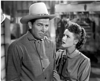
1947 GUNFIGHTERS de George Waggoner avec Barbara Britton