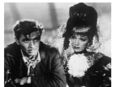
1941 LA BELLE ENSORCELEUSE (The Flame of New Orleans) de René Clair avec M. Dietrich