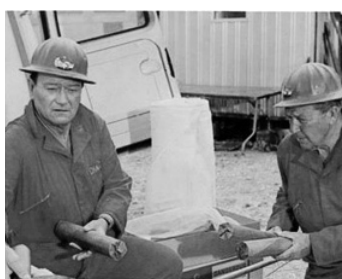
1968 LES FEUX DE L'ENFER (Hellfighters) d'Andrew McLaglen avec John Wayne