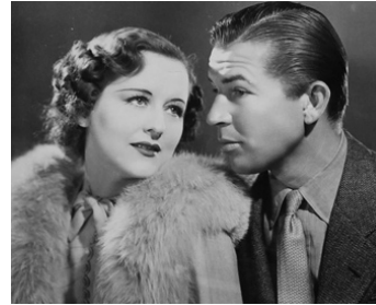
1945 LES AILES DE LA GLOIRE (Wings of Glory) de Conrad Nagel avec Beatrice Roberts