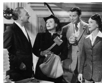
1939 SUZANNE ET SES IDÉES (Susan and God) de G. Cukor avec Joan Crawford, Nigel Bruce, Rose Hobart