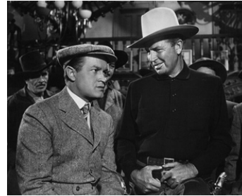
1949 FANCY PAINTS de George Marshall avec Bob Hope