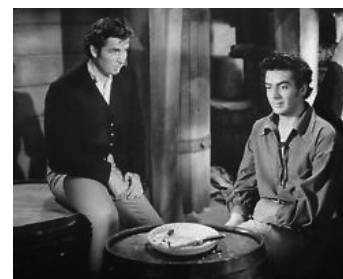
1940 CAPITAINE CASSE-COU (Captain Caution) de Richard Wallace avec Victor Mature