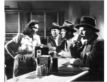
1945 CRIME PASSIONNEL (Fallen Angel) d'Otto Preminger avec Linda Darnell, Dana Andrews