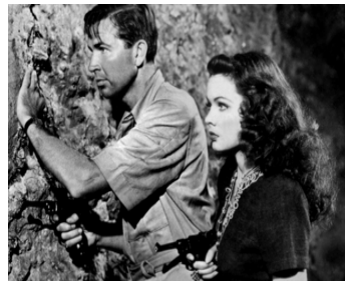
1941 CRÉPUSCULE (Sundown) de Henry Hathaway avec Gene Tierney