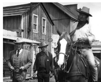
1970 CHISUM (Chisum) d'Andrew McLaglen avec John Wayne, Forrest Tucker