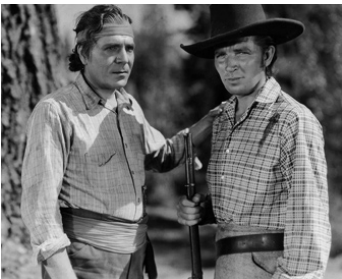
1936 ROBIN DES BOIS D'ELDORADO (Robin Hood of El Dorado) de W. Wellman avec Warner Baxter