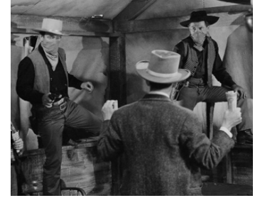
1947 L'ANGE ET LE MAUVAIS GARÇON (Angel and the Bad Man) de James E. Grant avec John Wayne