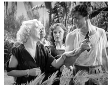
1938 SINNERS OF PARADISE de James Whale avec Madge Evans, Helen Twelvetrees