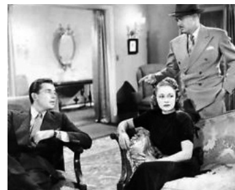
1939 MON FILS EST COUPABLE (My Son is guilty) de Charles Barton avec Wynne Gibson