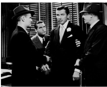
1938 SMASHING THE RACKETS de Lew Landers avec Chester Morris