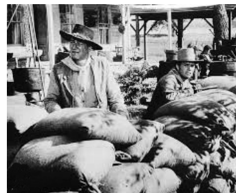
1961 LES COMANCHEROS (The Comancheros) de Michael Curtiz avec John Wayne