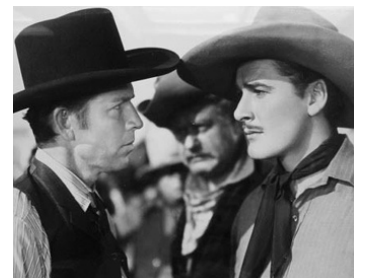
1939 LES CONQUÉRANTS (Dodge City) de Michael Curtiz avec Errol Flynn