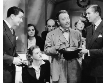
1936 THREE WISE GUYS de George B. Seitz avec Robert Young, Betty Furness, R. Walburn