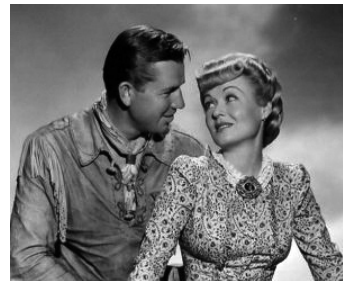
1941 WILD BILL HICKOK RIDES de George Marshall avec Constance Bennett