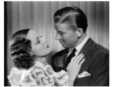
1933 DISGRACE (Disgraced) d'Erle C. Kenton avec Adrienne Ames